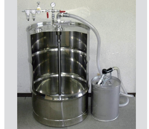
写真：リターナブルドラム缶 （撮影用にドラム缶の一部を切り抜いています）

リターナブルドラム缶は、ステンレス製で錆びにくく、上部の内側は TIG 溶接、底部も胴体と一体になっており、従来のドラム缶のように隙間が全くありません。底部が胴体と一体になっていることから、洗浄後の残留物が完全に除去する事ができます。また、充填のためのバルブは、ビールのビア樽のバルブ機能を産業容器用に開発した専用の特殊バルブと専用のカプラーから成り、密閉型の究極の環境対応容器として、洗浄レスでも利用しています。